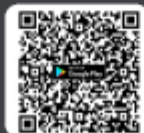
ดาวน์โหลด Application IR PLUS AGM suu Android Ver. 9 ขึ้นไป