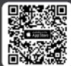
ดาวน์โหลด Application IR PLUS AGM suu iOS 15 ขึ้นไป

ในวันประชุม ผู้ถือหุ้น/ผู้รับมอบฉันทะ Log in เข้าสู่ระบบ IR PLUS AGM กรอกรหัส Pincode 6 หลัก เพื่อลงทะเบียนเข้าร่วมประชุม