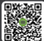
ผู้ต้องการใช้งาน suu IR PLUS AGM TH ภาษาอังกฤษ